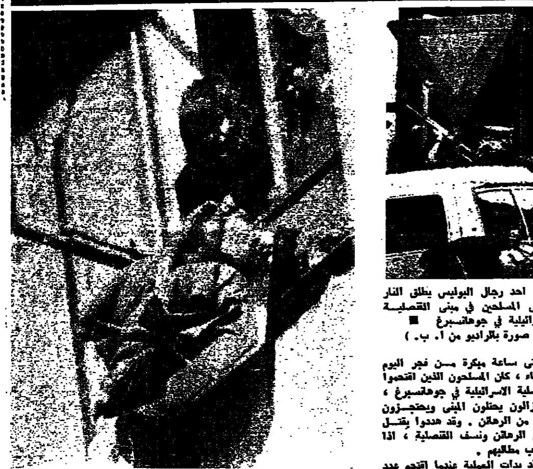
فئة من الرهائن نزل من إحدى نوافذ القنصلية الإسرائيلية في جوهانسبرغ

تعددت في معرض «راند» التجاري والصناعي، وسيتم توزيعها إذا لم تستجب مطالبهم. وقد ألقى البوليس الحربي من حوالي ٢٠ ألف شخص مخافتهم. وقال أحد رجال الاساف ان ثلاثة اشخاص امسوا بجرور في القنصلية ونقلت خضرة تحت الحراسة بيسوا انها من الرهائن طلب ارسال مواد طبية وغذائية وما الى القنصلية. وذكرت وكالات الانباء ان الهجوم على القنصلية بدأ خلال فترة الغداء ظهر امس، وانسحب اطلاق النار حوالي ساعة. وقالت وكالة «رويتر» ان المهاجمين كانوا يطلقون النار دون تمييز من نوافذ القنصلية، بينما انزعج الجرحى في الشارع ودمارهم تسيل. واستخدم البوليس مكبرات الصوت للتلقيح مع المهاجمين. وفي إحدى الفترات، اطل رجل من نافذة القنصلية وقال انه يريد التصديق على البوليس. ورد أحد رجال البوليس بواسطة مكبر للصوت قائلاً: قلت انه تريد